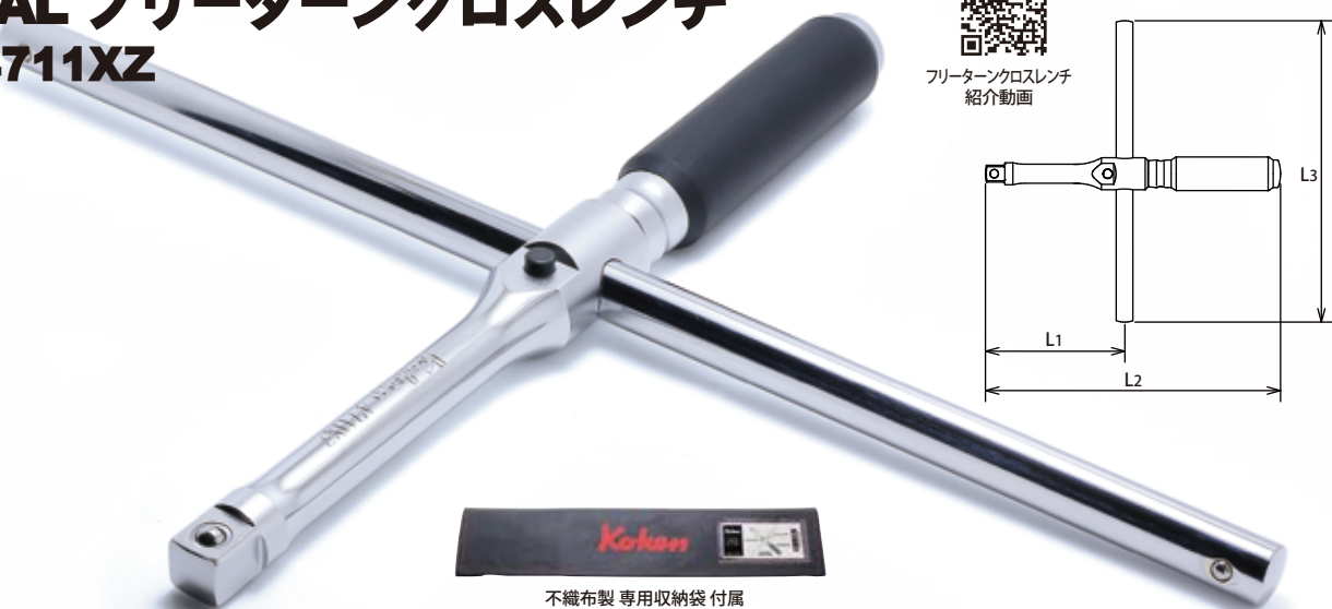
不織布製 専用収納袋 付属

好評のフリーターンクロスレンチ(4711X)の機能を向上。回転抵抗を下げ、よりスムーズに長時間回転することが可能となりました。さらにハンドルバーのセンターロック機構を搭載し、不意なハンドルバーのズレを防止します。